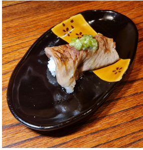
Wagyu Wasabi 和牛山葵