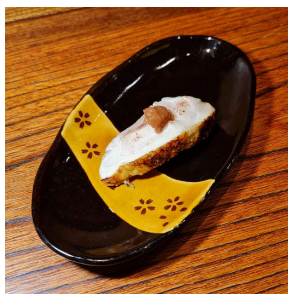
Roast Chicken Plum sauce 鶏梅肉