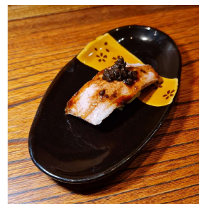
Roast Lamb w/Japanese pepper 仔羊山椒