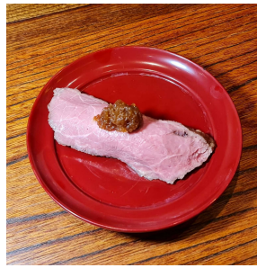
Roast beef ローストビーフ