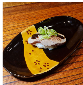
Roast Duck Miso sauce 鴨ネギ味噌