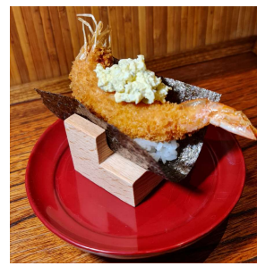
Shrimp Tartar 海老タルタル